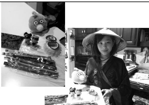
中国和台湾的东西都不贵，很便宜， 我买了很多回来美国。